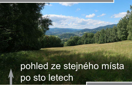
pohled ze stejného místa po sto letech