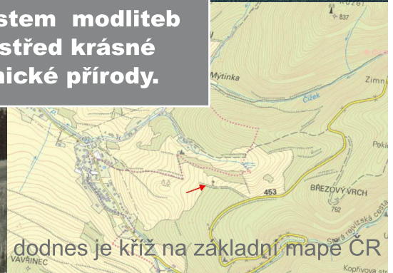
odnes je kříž na základní mapě ČR